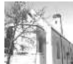
Hl. Geist Essing