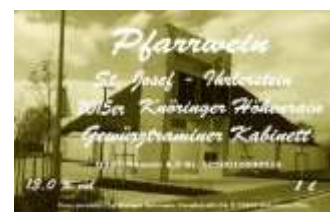
Weiß Gewürztraminer, halbtrocken 11

Je 1l-Flasche: 6,- €. Je 0,75l-Flasche 5,50 €. Zu haben im Pfarrbüro (zu den Öffnungszeiten) jederzeit oder beim nächsten Weinverkauf in der Pfarrkirche am Erntedanksonntag 1./2. Oktober 2016. Der Förderverein Kirchensanierung wünscht „Prosit! Wohl bekomm’s!“.