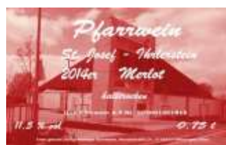
Rot, Merlot halbtrocken 0,75l