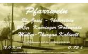
Weiß, Müller Thurgau trocken 0,75l