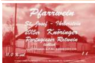
Rot, Portugieser lieblich 11