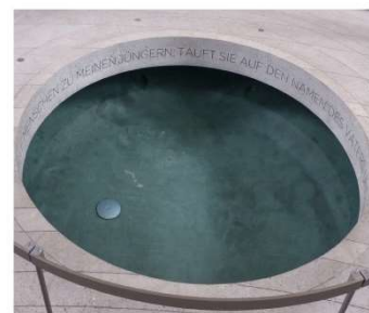
Taufbecken in St. Peter und Paul, Eisleben

Jesus lässt sich von Johannes im Jordan taufen. Seine Taufe zeichnet den Beginn seines Wirkens. Jesus geht fortan seiner Bestimmung nach. Die Taufe ist auch der Beginn unserer Beziehung mit Gott sowie unserer Bestimmung als Christ. Am Festtag Taufe des Herrn erinnern wir uns daran und erneuern im Taufgedächtnis unsere Verbundenheit mit Gott, damit wir gestärkt unserer Bestimmung folgen und sein Licht in die Welt tragen. Kinder bringen zum Gottesdienst ihre Taufkerzen incl. Kerzenhalter mit.