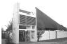
St. Josef Ihrlerstein