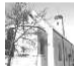
Hl. Geist Essing

für die katholische Pfarreiengemeinschaft Nr. 16 48. Jahrgang 15.11.2014 - 7.12.2014