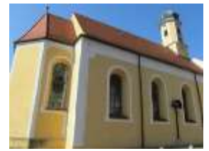
Hl. Geist, Essing

Nr. 7 51. Jahrgang 20. Mai 11. Juni 2017