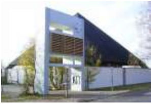
St. Josef, Ihrlersstein